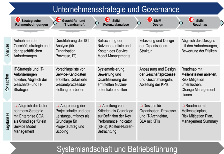
Bild 2: Vorgehensmodell zur Einführung eines Service Model Managements

Zur Steuerung der Zusammenarbeit werden die Unternehmen in interne und externe Serviceeinheiten gegliedert, die nach bestimmten Geschäftsregeln miteinander flexibel agieren können [1]. Diese Organisationsform wird auch Service orientierte Organisation (SOO) genannt. Das Ziel ist es, Synergien zu nutzen und durch Standardisierung und Automatisierung mehr Effizienz gegenüber der Konkurrenz zu erlangen. Durch die Etablierung und Förderung selbstorganisierter Teams, durch eine Service orientierte Organisation mit weitgehenden Entscheidungs- und Handlungsfreiräumen, aber auch durch Rechenschaftspflicht und Ergebnisverantwortlichkeit steigen die Anforderungen an die Organisationsentwicklung. Zwischen den internen und externen Serviceeinheiten der kooperierenden Unternehmen werden die entsprechenden Geschäftsregeln, Prozesse und Kontrollmechanismen in Service Level Agreements vereinbart. Die Steuerung dieser Prozesse erfolgt über ein Business Rule Management. Um eine flexible Infrastruktur bereitzustellen, verwenden Unternehmen die Service orientierten Architekturen (SOA). Die Services sind modulare Bausteine und lassen sich in Geschäftsprozesse fle-