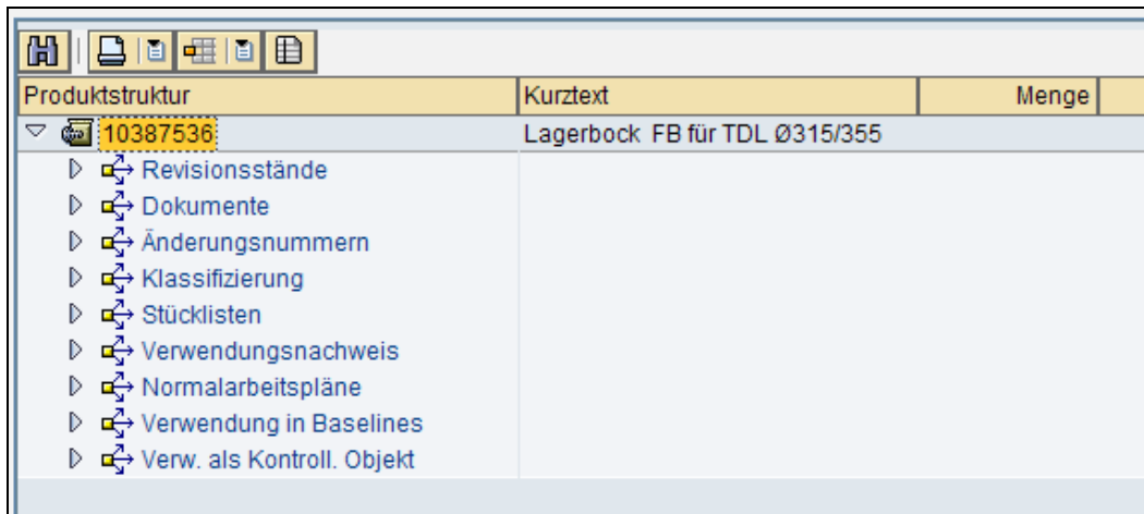
Abbildung 1: SAP Produktstruktur

Produktdatenmanagement (PDM) ist ein Konzept, um produktdefinierende und repräsentierende Daten und Dokumente als Ergebnis der Produktentwicklung zu speichern, zu verwalten und in nachgelagerten Phasen des Produktlebenszyklus zur Verfügung zu stellen. Grundlage für PDM im SAP Umfeld ist die Produktstruktur. Die Hauptobjekte der SAP Produktstruktur sind Materialstamm, Stücklisten und Dokumente, die durch weitere Objekte ergänzt werden (siehe Abbildung 1).